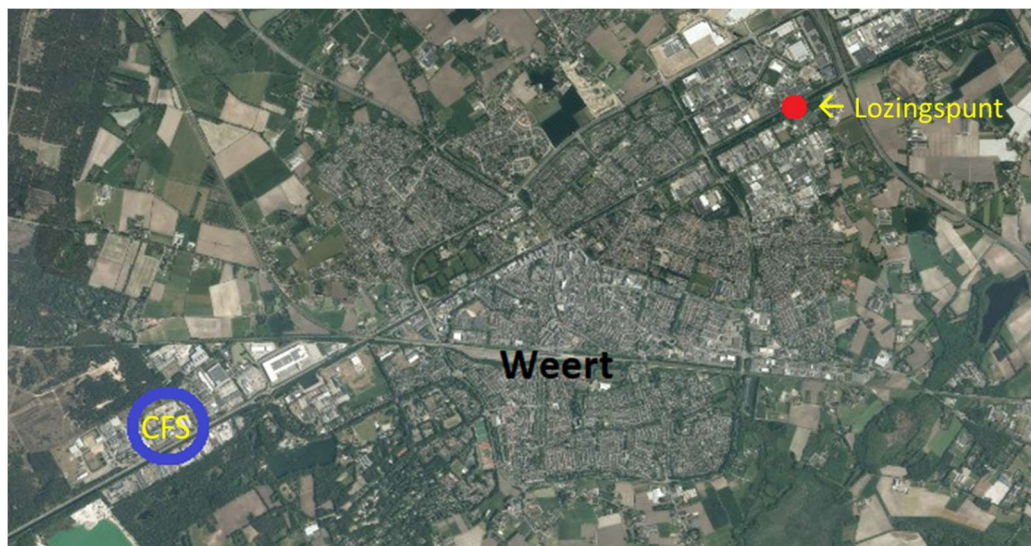
Figuur 1 Ligging CFS en Lozingspunt RWZI Weert

In Figuur 1 is de ligging van de installatie (blauw) en het lozingspunt (rood) weergegeven.