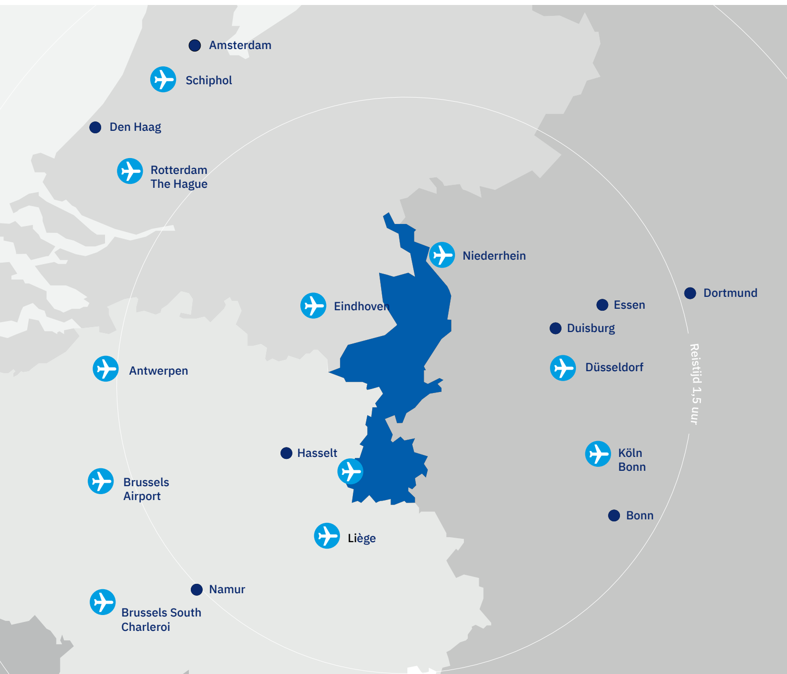
Afbeelding 1: De centrale ligging van Limburg in Noordwest-Europa