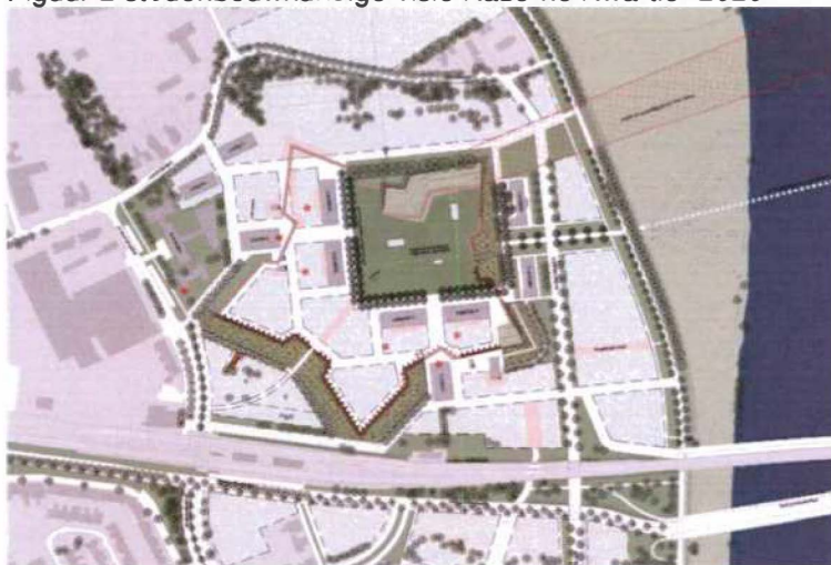
Figuur 2 stedenbouwkundige visie Kazerne Kwartier 2020

De stedenbouwkundige visie voor het Kazernekwartier (fig. 2) beoogt haar historische context, de situering aan de Maas en de aanwezigheid van een intercitystation te benutten voor de ontwikkeling van een hoogwaardig en gevarieerd stedelijk gebied met een mix van functies waaronder het stedelijk wonen, onderwijs en dienstverlening. Centrum-stedelijk wonen wordt een belangrijke bouwsteen. De mix van functies zal verder bestaan uit werken -dienstverlening en 'schone' bedrijvigheid- en diverse stedelijke voorzieningen, zoals horeca, onderwijs en leisure.