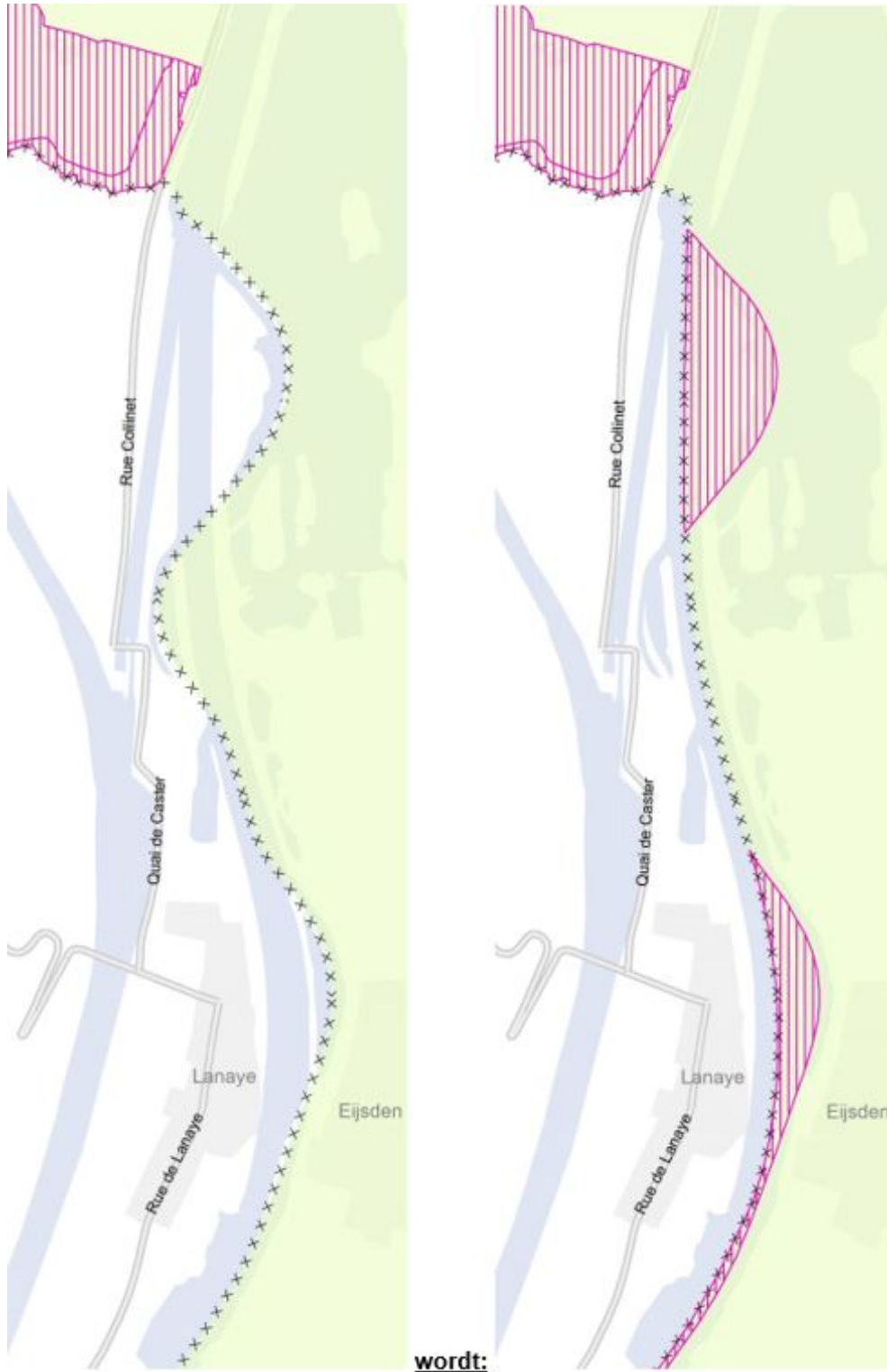
F Kaart 8 Milieubeschermingsgebieden (bij de paragrafen 4.2 t/m 4.6) wordt als volgt gewijzigd: • Beschermingsgebied Nationaal Landschap Zuid-Limburg